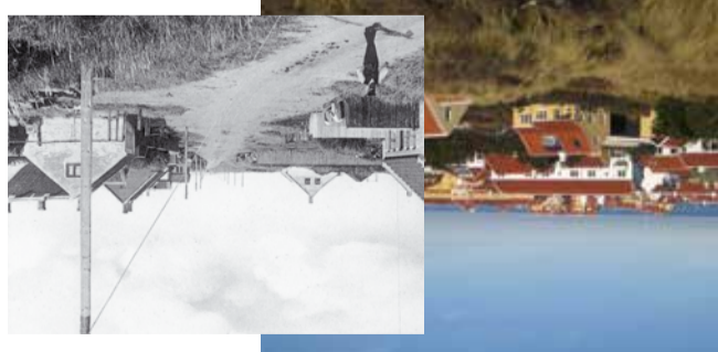
Udkig over Højen Højen før 1912

Højen var oprindeligt en fiskerby med kystfiskeri som speciale. Før bygningen af Skagen Havn foregik en stor del af fiskeriet med landdragningsvodd ved Højen. Derudover har Højen også fungeret som fixpunkt for de søfarende. Sømærket står der stadig – nu en kopi – som et eksempel på et bakesystem, man i 1800-tallet opsatte langs den jyske vestkyst for at vejlede de søfarende op til fyrterne og belysningen ved Skagen Odde spids.