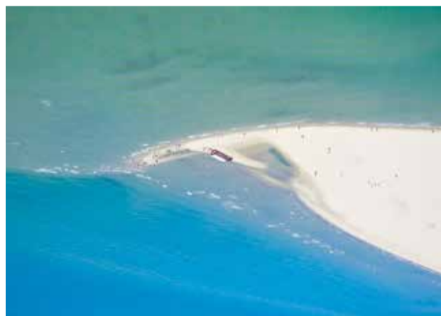
Grenen er under konstant forandring og er næppe ens to dage i træk.

En del af odden var dengang dækket af skov, hovedsagelig egeskov, som man endnu kan finde krallignende rester af, men der var også moser og enge i et særegent mønster med baggrund i rimmedoppe landskabet. Alt i alt et frugtbart landskab med gode muligheder for kvægdrift. Da sandflugten havde hæret i ca. 200 år, lå resterne af bøndergårde og markerne imidlertid under et flere meter tykt lag sand.