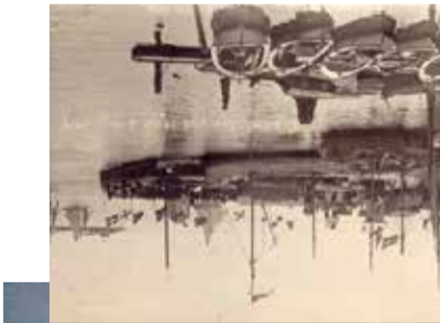
Øverst: Hals Havn i sejlskads fra havnen i 1919.

Hals ligger godt beskyttet fra øst med store lavandede områder langt ud i Kattegat. Ved indsejlingen blev det markante og karakteristiske Hals Barre Fyr opført i 1912.